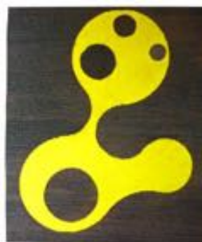
Albert Goederond Zwart 2014 49 x 41,5 x 0,8 multiplex, verf